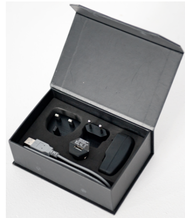
Zestaw końcówek zasilających